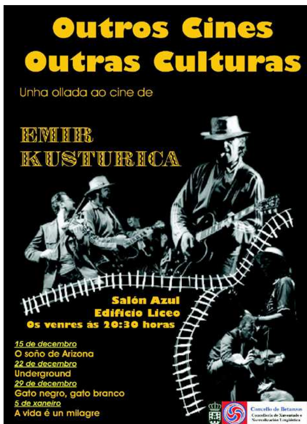
Imagen del cartel del ciclo dedicado a Emir Kusturica.