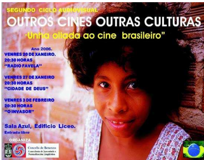
Imagen del cartel del ciclo dedicado a Brasil

Así en estos últimos años se han realizado ciclos de cine sobre el problema de Palestina, sobre la pobreza en Brasil o sobre el cine del director balcánico Emir Kusturica.