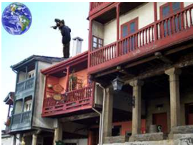
Imagen del cartel utilizado para la presentación del festival

Pero sin duda la apuesta más fuerte es la puesta en marcha de un festival de cine. El Ayuntamiento de Betanzos está trabajando en la organización de un festival de Cine Documental de cara a finales del año 2008. Este tendrá lugar previsiblemente dentro del mes de diciembre y llevará el nombre de XÓM (Xanela ó mundo), que significa Ventana al mundo en lengua gallega, puesto que con él se pretende abrir una ventana desde la ciudad a otras realidades culturales y sociales. La organización del mismo responde al interés continuo del gobierno local por promover y desarrollar actividades culturales que enriquezcan y aporten una solvencia formativa a los ciudadanos de la comarca de Betanzos.