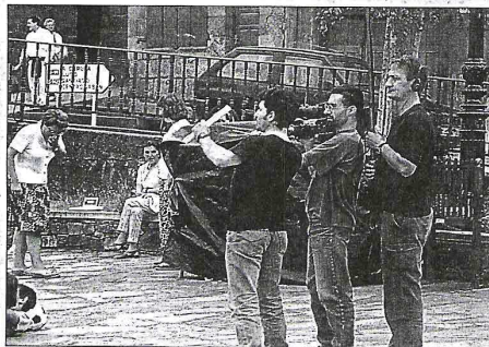
Un momento del rodaje del cortometraje en las inmediaciones del Paseo del Malecón

Con motivo de la realización del curso de verano "Música y Cine", que desde el pasado lunes se imparte en la ciudad brigantina, se ha comenzado a rodar un cortometraje con exteriores de Betanzos. Durante los dos próximos días el equipo del Servicio de Medios Audiovisuales de la Universidad de A Coruña, bajo la dirección de Xosé Vilaboy, se encargará de la realización de este filme. En él participarán los alumnos del curso, que darán vida a tres personajes, un chico y dos chicas. En la jornada de ayer, el lugar escogido para la grabación de los exteriores ha sido la zona del Malecón de A Ribeira, así como la zona del Puente Viejo. Ya en la zona nueva, las terrazas de los Soportales han sido el otro lugar escogido por la organización para rodar distintas tomas.