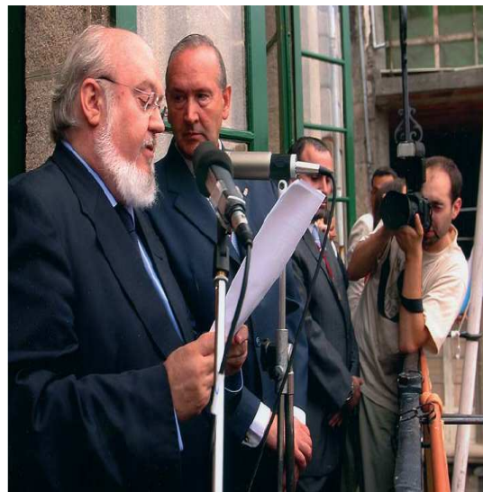
José Luis Cuerda